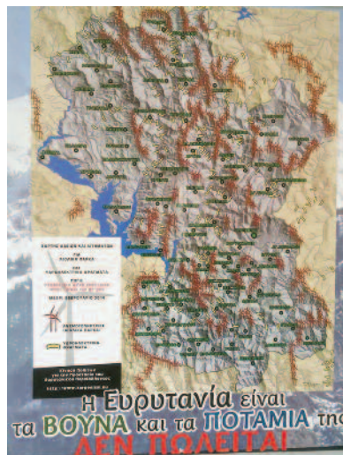
Η Ευρυτανία είναι τα ΒΟΥΝΑ και τα ΠΟΤΑΜΙΑ της ΑΕΝ ΠΟΛΕΙΤΑΙ

Αποτέλεσμα αυτής της εκδήλωσης ήταν η καθολική βούληση των συμμετεσχόντων • Να δηλώσουν την αντίθεσή τους στην εγκατάσταση Αιολικών Πάρκων (ΒΑΠΕ) στα Άγραφα • Να δηλώσουν την αντίθεσή τους στην εκχώρηση της Δημόσιας γης στις εταιρείες στο όνομα του κέρδους